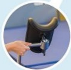
Reposes jambes intégrés au lit