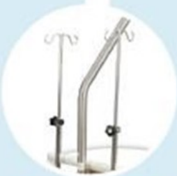
Tige porte sérum