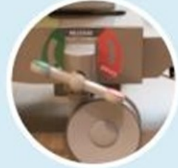
Roues avec frein